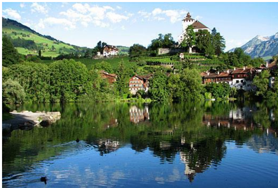
Werdenbergersee mit Städtli und Schloss

ESV Rheintal Walensee Abt. sports de montagne