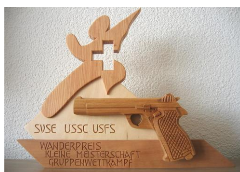
Wanderpreis Gruppe Pistole