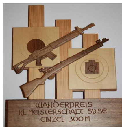
Wanderpreiss Einzel 300m Neu seit 2011